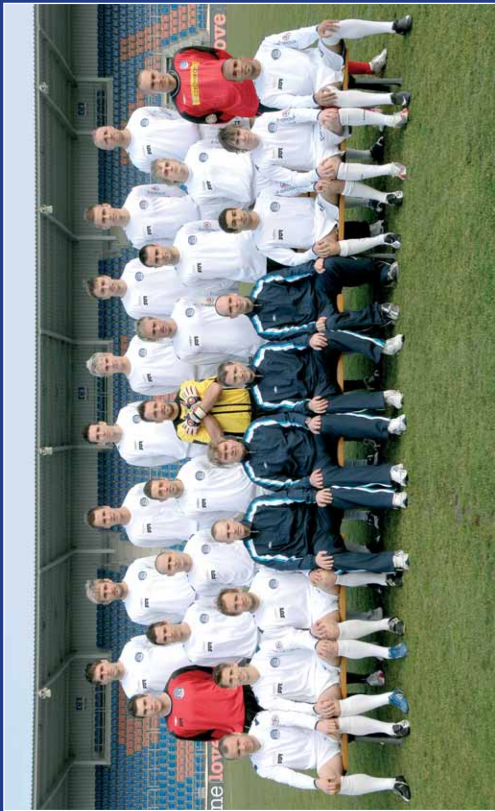
1. FC SLOVÁCKO