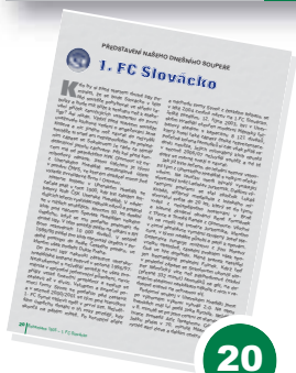
Antonín Panenka Prezident Bohemians 1905

Jelikož jsme považováni za jasné favority, ostatní proti nám většinou jen brání. Je to dobrá zkouška pro všechny hráče. Vždycky se říká, že je lepší bojovat, než tvořit. Takže užijme si tvoření, pak nás čeká liga a tam už to bude zase jiný příběh.