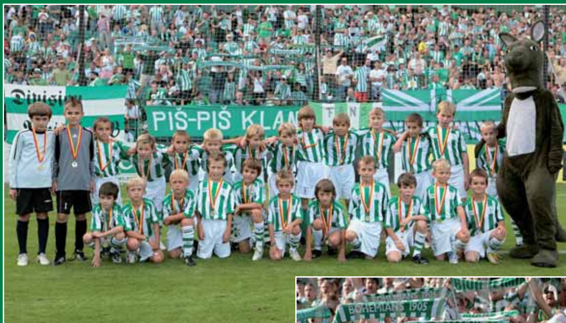
Bohemians 1905 – FC Viktoria Plzeň