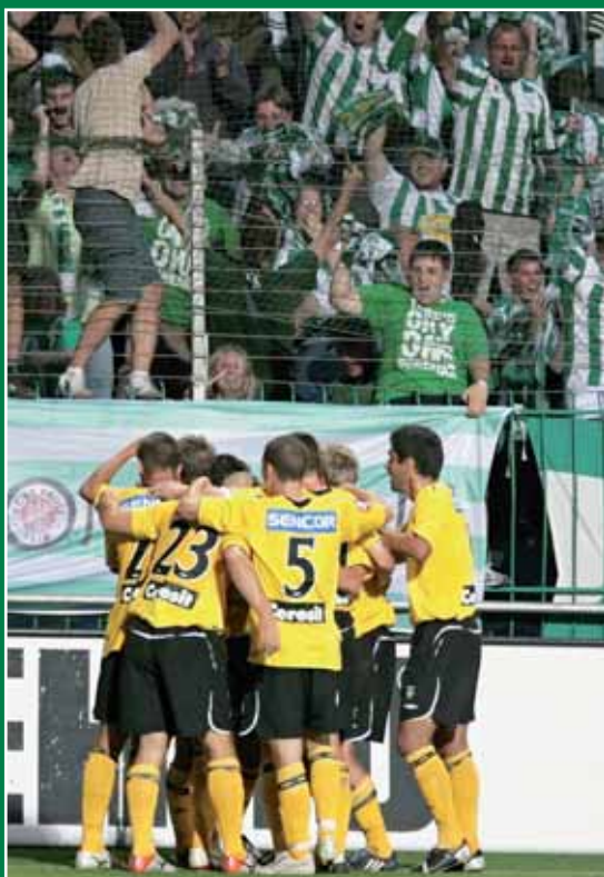
FK Mladá boleslav – Bohemians 1905