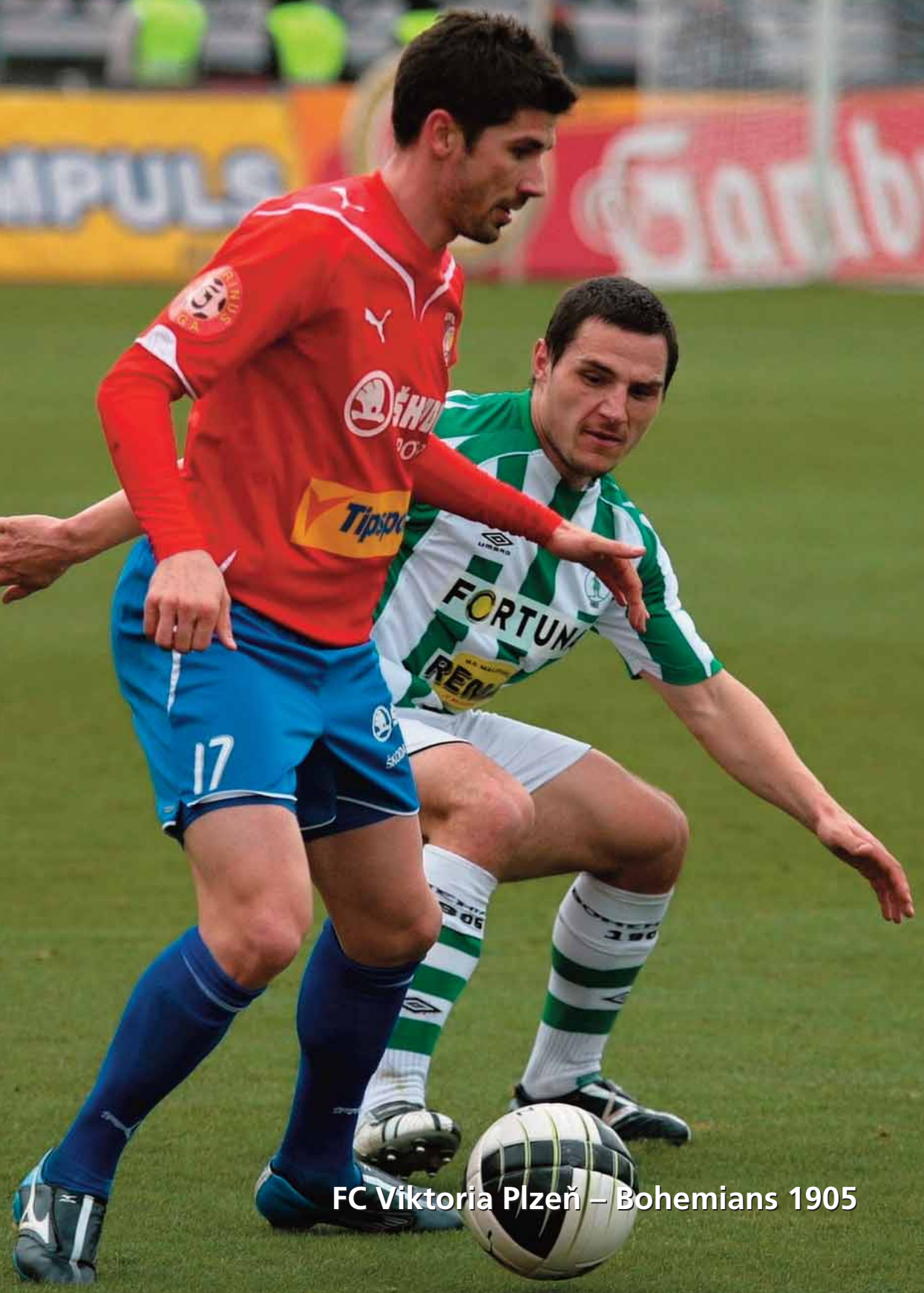
FC Viktoria Plzeň – Bohemians 1905