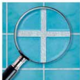
Spárovací hmota Ceresit s recepturou MicroProtect