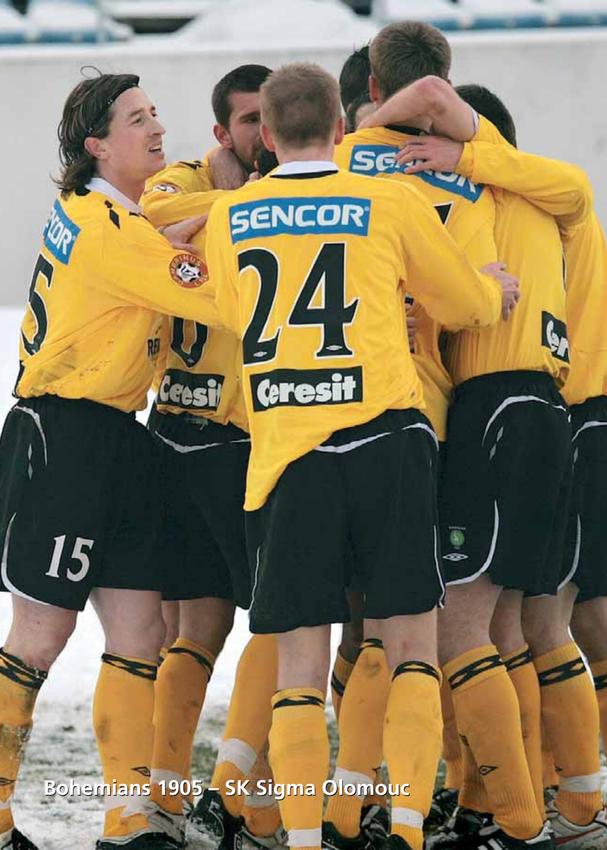
Bohemians 1905 – SK Sigma Olomouc