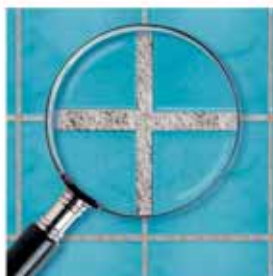
Běžná spárovací hmota

Spáry zůstanou čisté a krásné na opravdu dlouhou dobu!